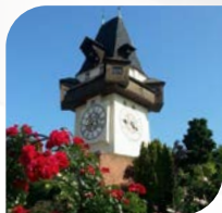
Foto-Tour Graz (2 in 1)