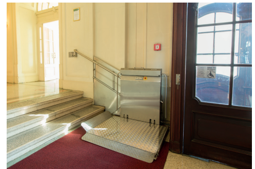
Stufen und Treppenlift