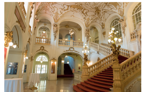
Foyer mit Hauptstiege