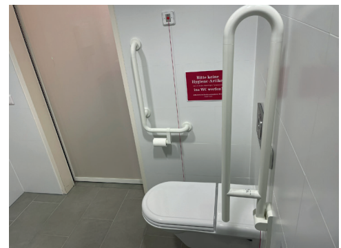
Barrierefreies WC Studiobühne