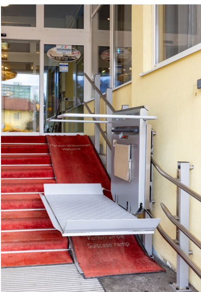
Eingang mit Treppenlift