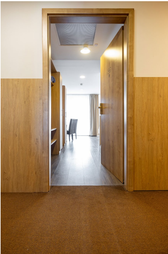
Zugang Zimmer Nr. 3403