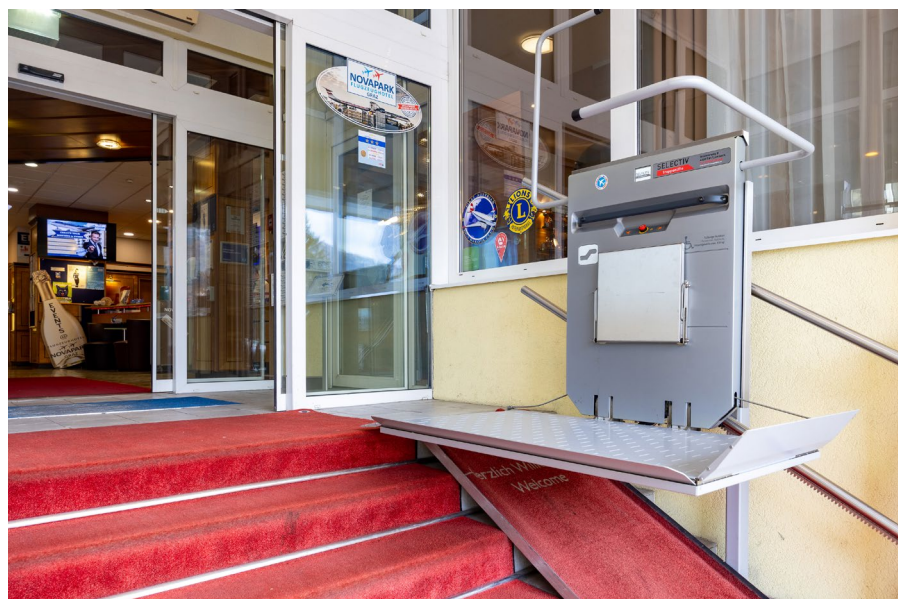
Eingang mit Treppenlift