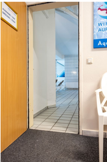
Zugang Wellnessbereich (UG)