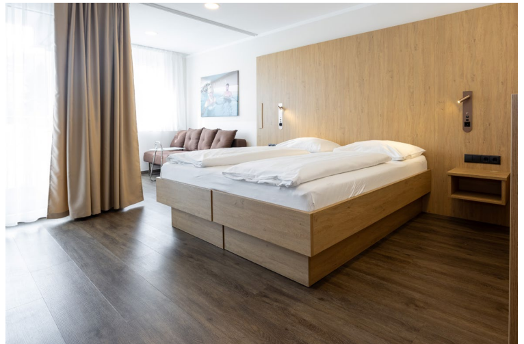
Zimmer Nr. 3403