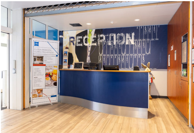
Rezeption im EG (ohne Beschreibung)