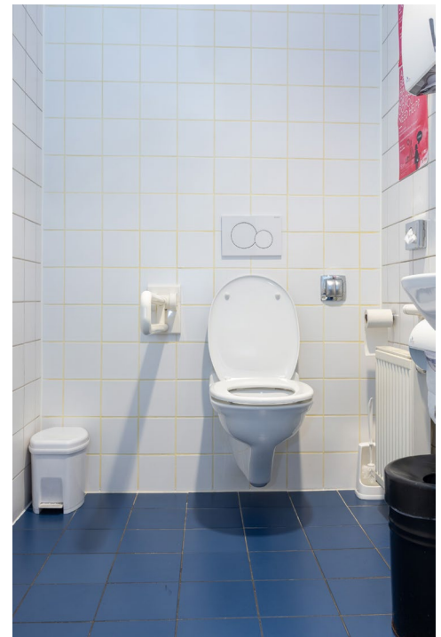
Allgemeines barrierefreies WC