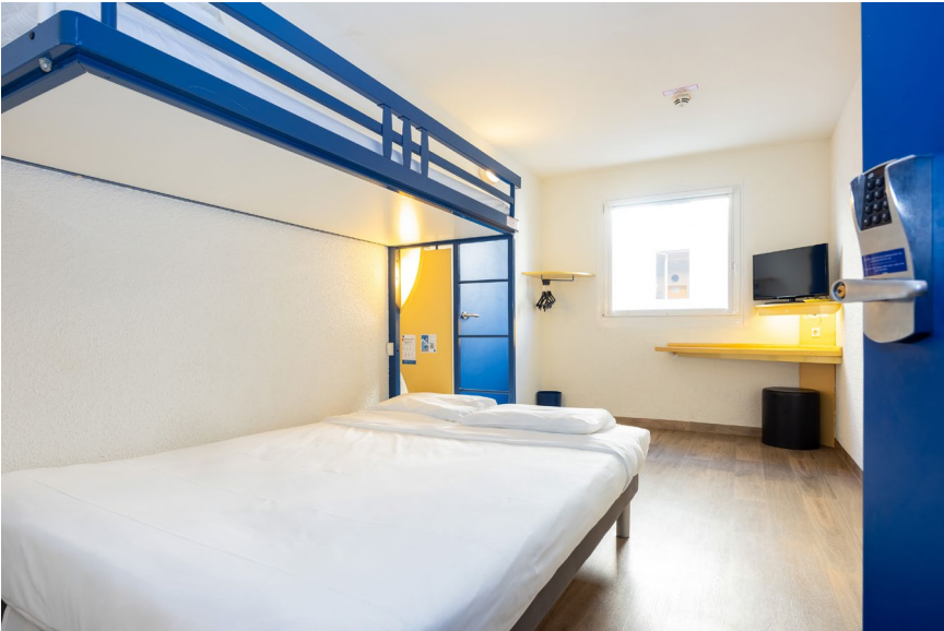
Barrierefreies Zimmer Nr. 110