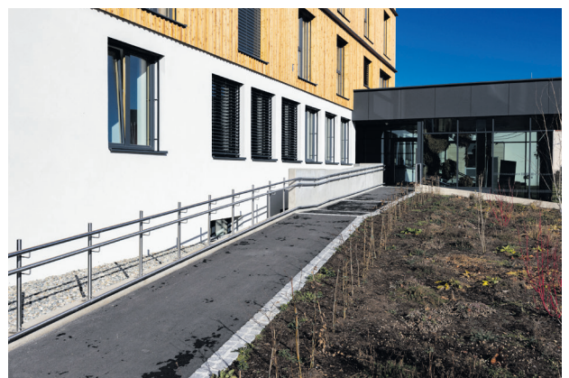
Rampe zum barrierefreien Eingang