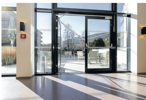
Zugang zur Terrasse