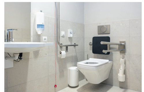
Barrierefreie WCs im Hotelbereich