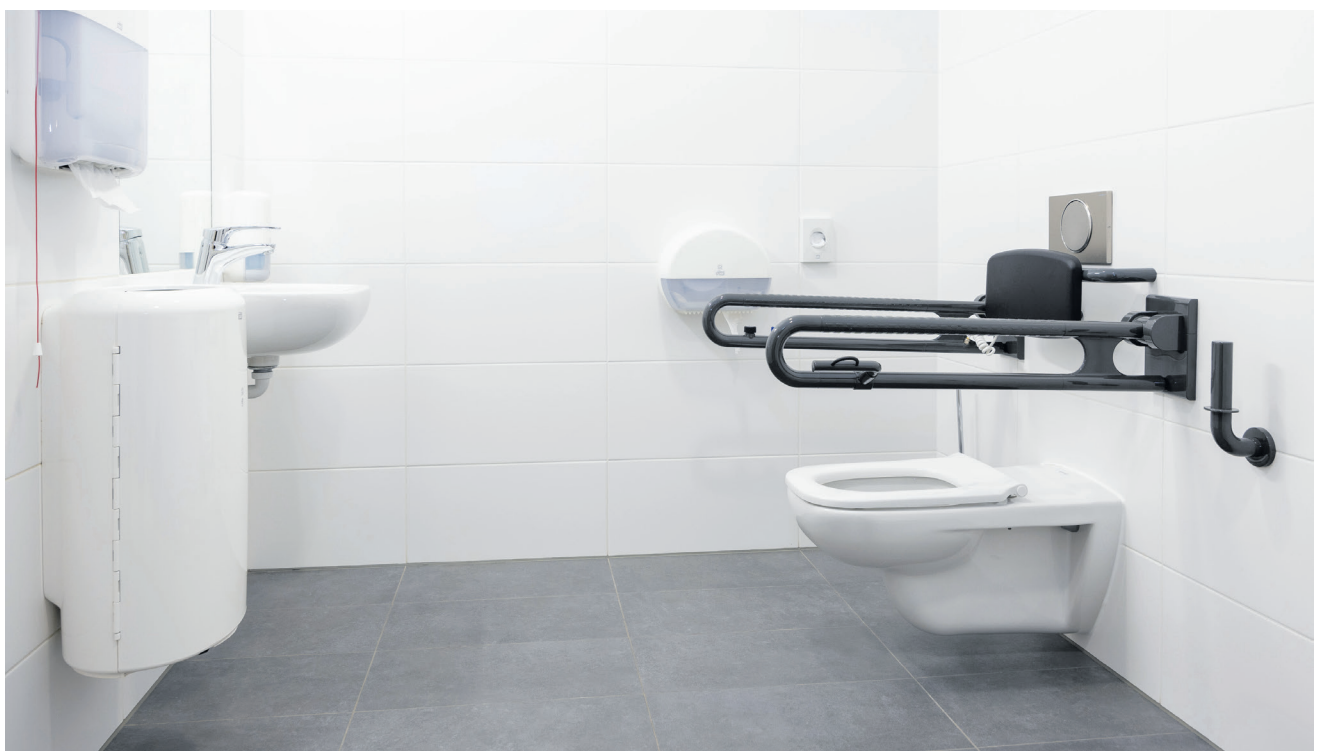
Barrierefreies WC im Seminarbereich