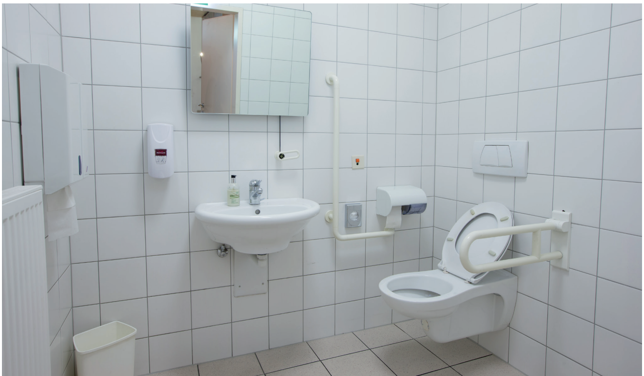
Barrierefreies WC (EG)