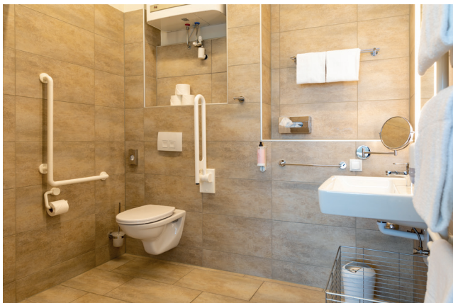
Bad Zimmer 202