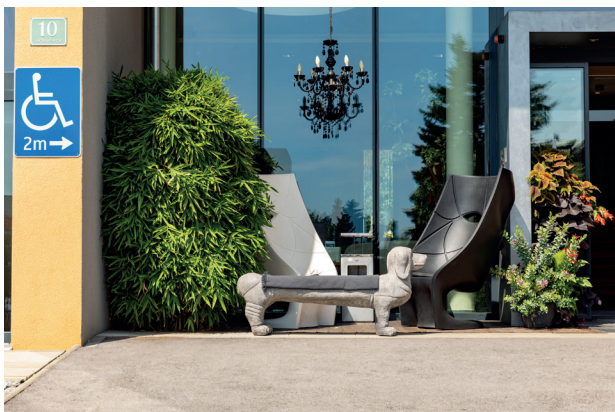
Parkplatz vor Haupteingang