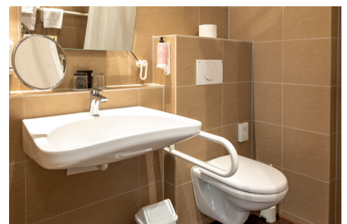
Bad Zimmer 51