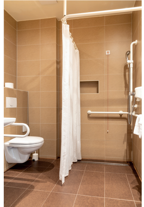
Bad Zimmer 51