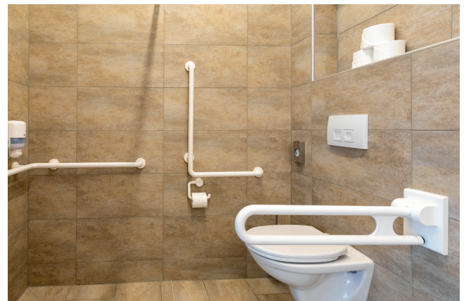
Bad Zimmer 202