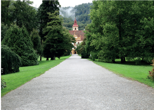
Weg durch den Park