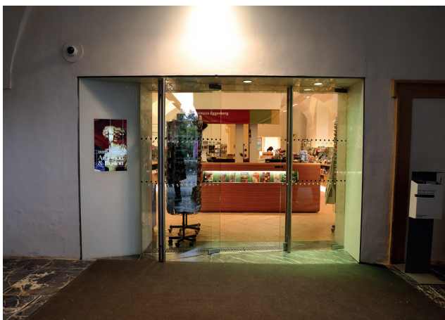
Kassa und Shop