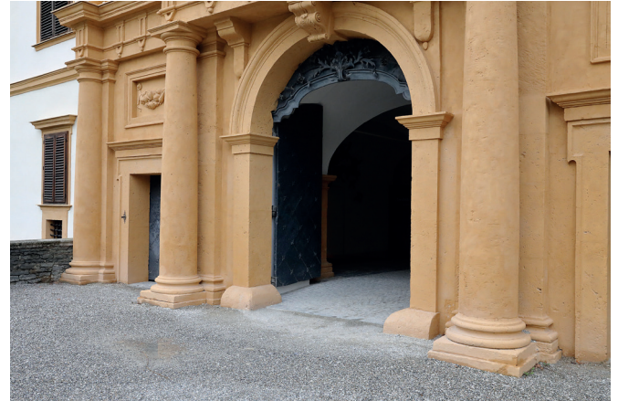
Eingang Schloss Eggenberg