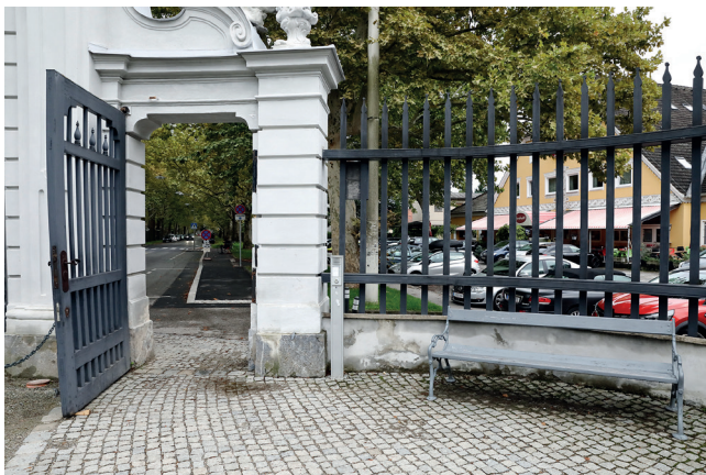
Parkplätze und Parkeingang