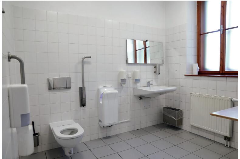
Barrierefreies WC beim Parkeingang