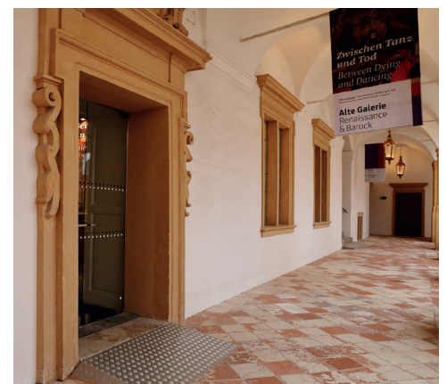
Eingang Alte Galerie