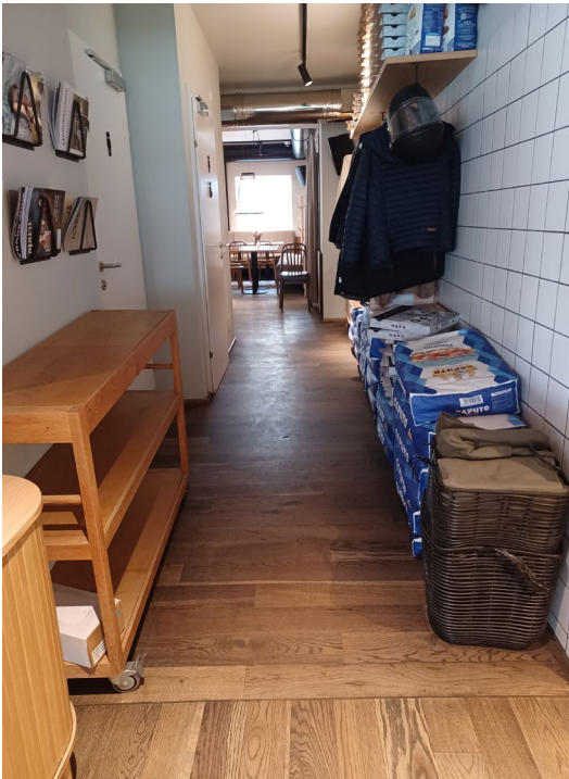
Zugang zum WC