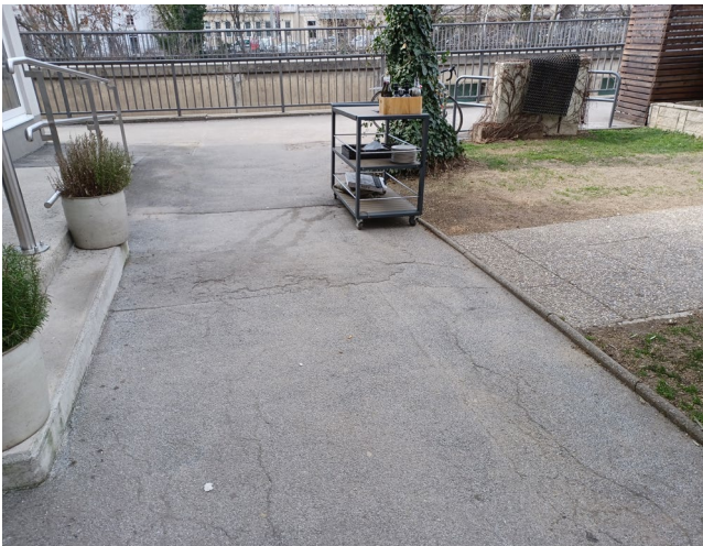
Übergang zum Gastgarten