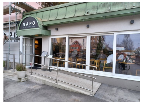
Eingang mit Rampe