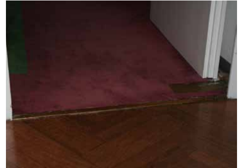
Übergang zu WC