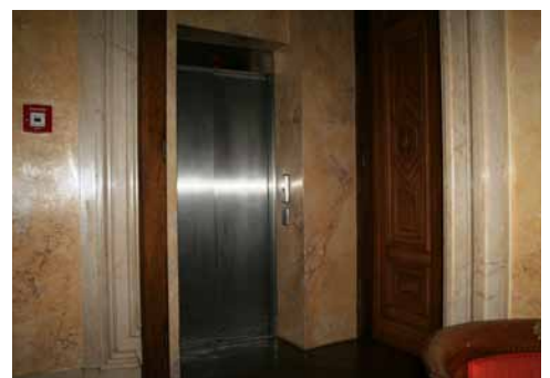
Lift Ausgang Veranstaltungsräume