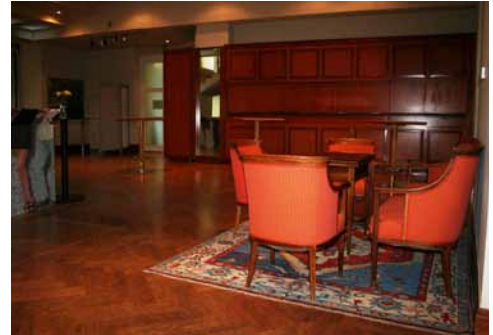
Foyer & Bar