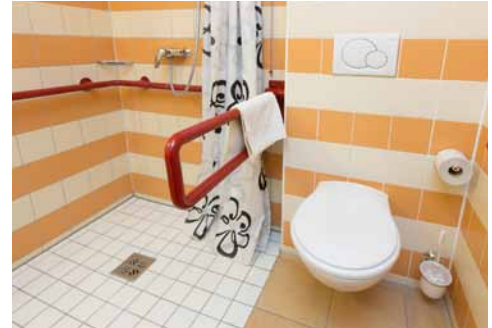
WC in Bad