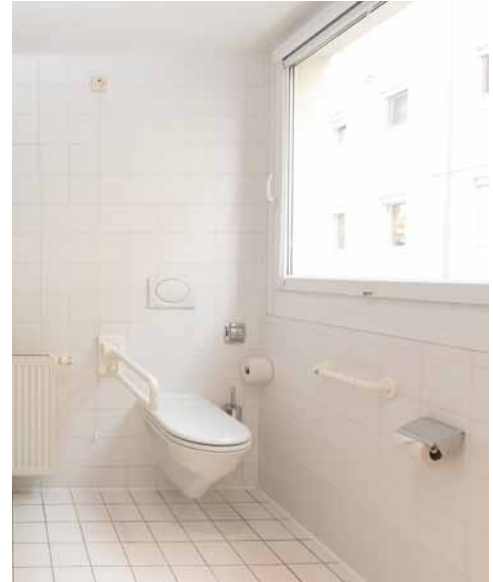
WC im Bad