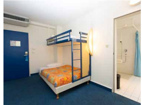
Zimmer mit Eingang zu Bad