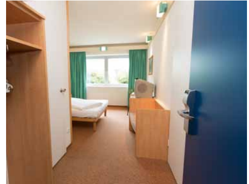
Eingang in Zimmer