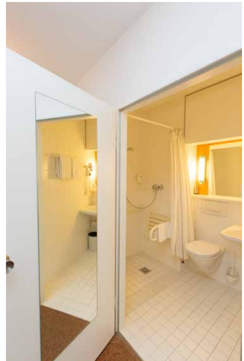
Eingang zu Bad im Zimmer