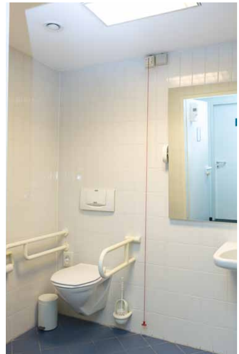
Barrierefreies WC allgemein