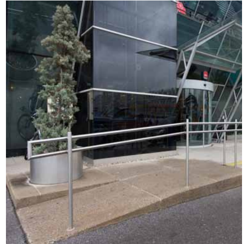
Rampe zu Hoteleingang