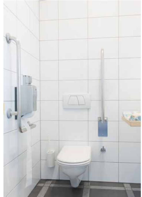
Barrierefreies WC Erdgeschoss