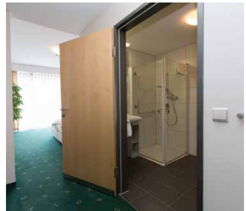
Eingang zu Bad im Zimmer