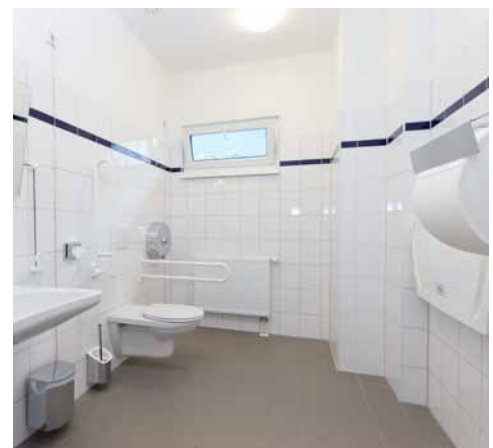
Barrierefreies WC EG