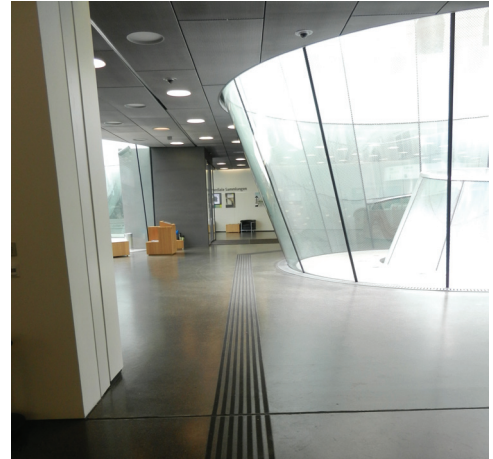
Eingangshalle von Lift kommend