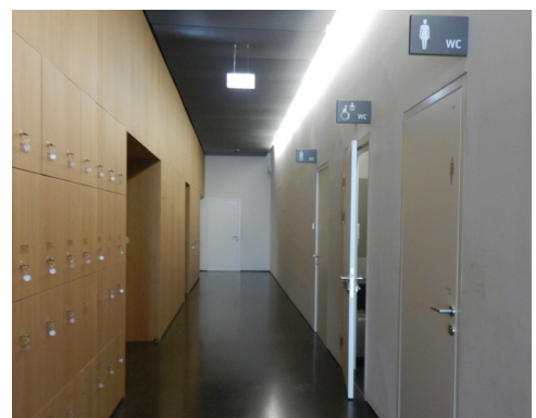
Kästen, Eingang WC