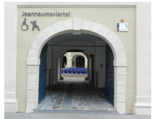
Eingangstor und -Türe