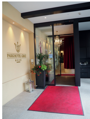
Zugang vom Parkplatz